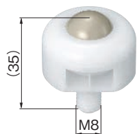
ボール径φ \frac{5}{8} inch