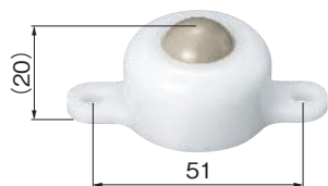
ボール径φ \frac{5}{8} inch